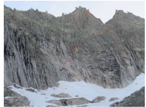
Route durch die S-Wand