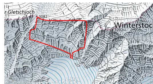
Karteausschnitt Winterstock W-Gipfel und Unter Gletschjoch