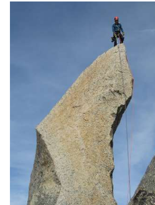
Florian Büchting auf der Gipfelnadel